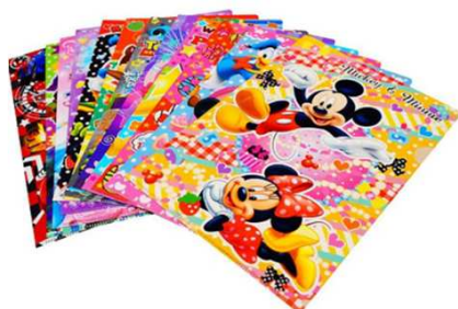
キャラクターファイル パールボールペン