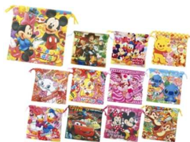
キャラクター巾着袋 プリマタオールハンカチ